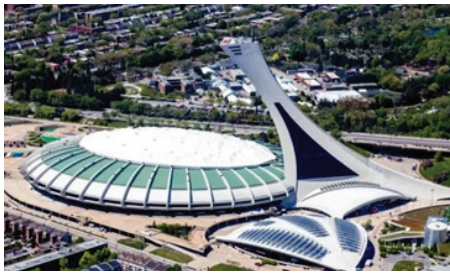
a. Le stade olympique de Montréal