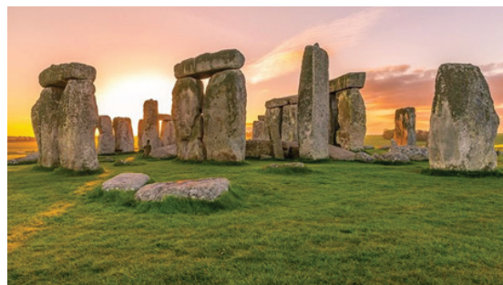
d. Stonehenge en Grande-Bretagne