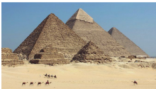
c. Les pyramides d'Égypte