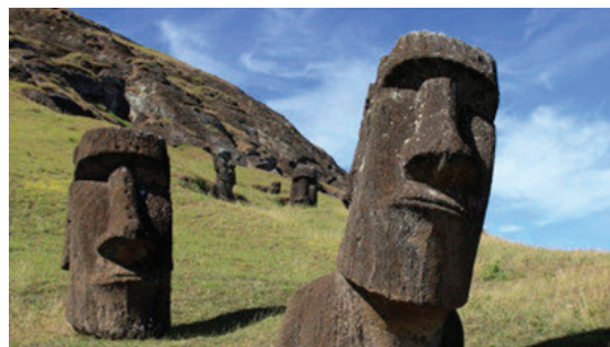
b. Les statues Moai de l'île de Pâques