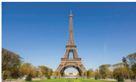
b. La Tour Eiffel