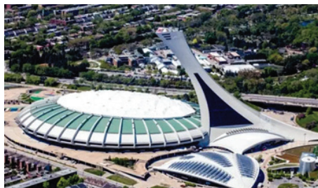
a. Le stade olympique de Montréal

4. Quels sont les deux lieux que tu as identifiés sur la courtepoinTE?