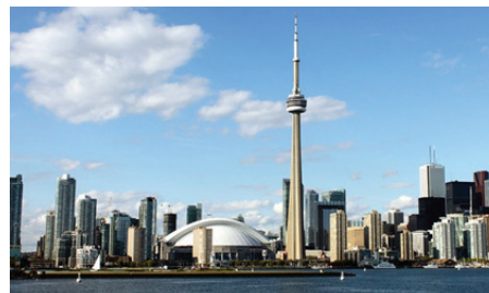
c. La silhouette de Toronto

5. Quel est le détail de la courtepoinTE qui t'a le plus interpellé? Explique pourquoi?